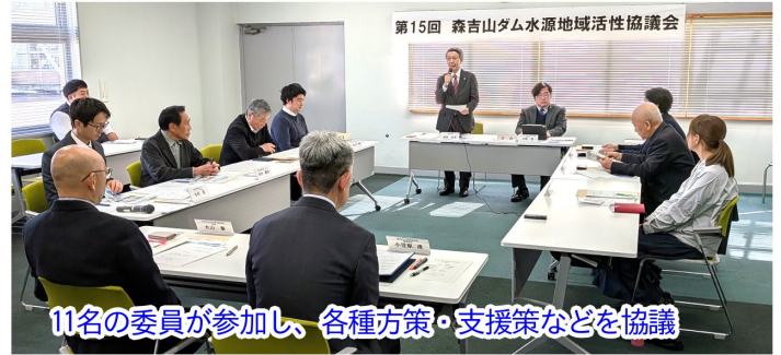
11名の委員が参加し、各種方策・支援策などを協議

その後、会員の方々から助言や提言をいただき議論を深めました。地域に点在する名所を連携させる等、協力した賑わいづくりを目指していくことを確認しました。