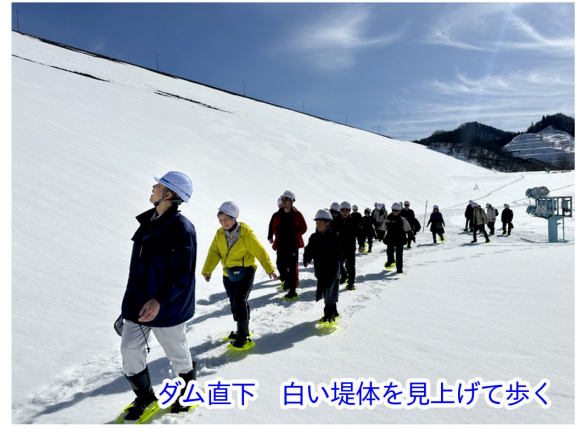
ダム直下 白い堤体を見上げて歩く