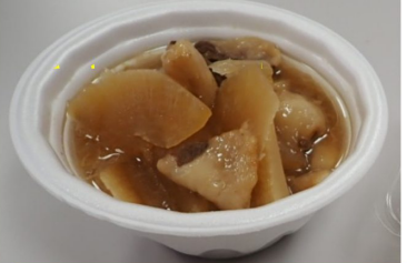
地元有志「きずなの会」作の熊鍋

《森吉山ダム冬の地下ウォーキング》について、たくさんのご応募本当にありがとうございます。定員をはるかに上回る応募をいただき、反響の大きさに驚くと共にとても嬉しかったです。当日は天気も良く、怪我人なく無事にイベントを終了させることができました。改めまして、参加していただいた皆様お疲れさまでした。