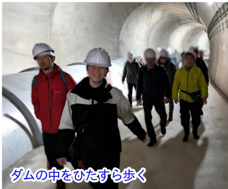
ダムの中をひたすら歩く