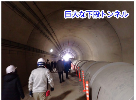
巨大な下段トンネル