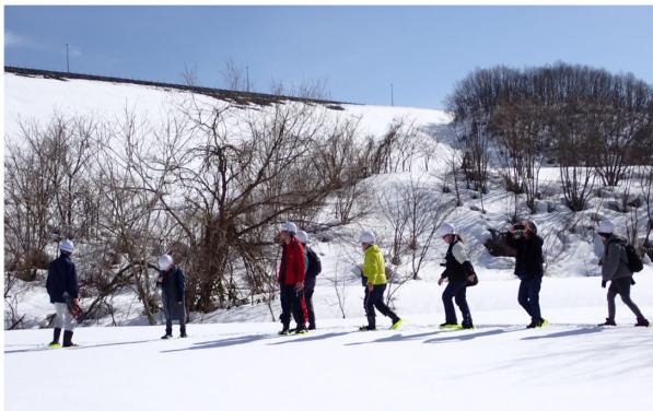
かんじきを履いての雪上歩行