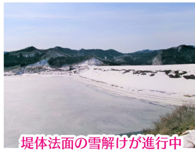
堤体法面の雪解けが進行中

開館時間は9：00～16：00まで。ぜひご家族そろって東北最大級のロックフィルダムを見に来てください♪お待ちしております！