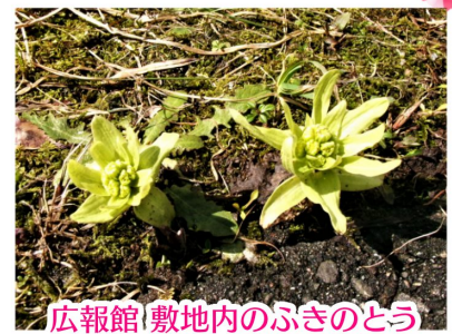
広報館敷地内のふきのとう

雪深い森吉山ダム周辺も春の気配を感じるようになりました。新しい季節を迎えるとともに、本コーナーの担当者がバトンタッチします！次号から新たな目線で情報をお届けします！私は森吉山ダムには小学生の頃にダム完成前の式典で訪れて以来でしたが、何よりも四季が美しく、毎日この景色を眺めることができ幸せでした(^^) 大変お世話になりました。ありがとうございました！