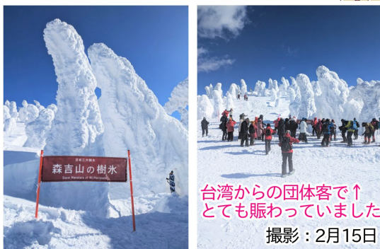
台湾からの団体客で↑とても賑わっていました 撮影：2月15日

森吉山ダムから車で約50分の阿仁スキー場では日本三大樹氷の1つ「森吉山の樹氷」が有名です。今年は積雪が多く迫力のある樹氷が見られましたよ！