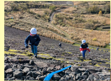
森吉山ダムで 実施中の様子↑