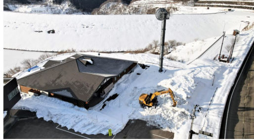
ダム広報館前の排雪状況↓

また、北秋田市では3月6日(木)までの期間【雪下ろし注意情報】が発表されています。雪下ろしを行う際は、必ず命綱やヘルメットを着用し、2人以上で作業するなど、事故防止のための安全対策をお願いします。