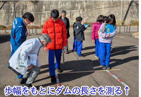
歩幅をもとにダムの長さを測る↑