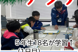
5年生18名が学習↑ (1日目)

【アクティブラーニング】とは？↓ 教員の一方的な講義形式の授業ではなく、児童が能動的に考え、学習する教育法のこと。