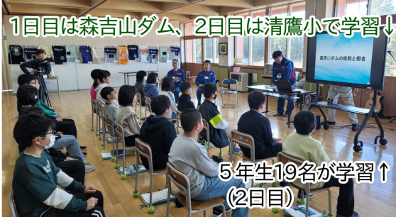
1日目は森吉山ダム、2日目は清鷹小で学習↓