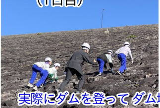
実際にダムを登ってダム堤体の材質や角度などを調べました↑