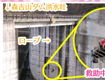
↓森吉山ダム洪水吐