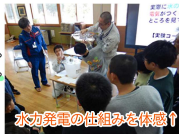
水力発電の仕組みを体感↑

今回の学習で児童の皆さんからは「学習したことを今後に繋げていきたい」など、たくさんの感想をいただきました！