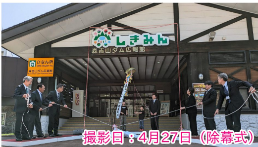
撮影日：4月27日（除幕式）

森吉山ダム広報館は12月から冬季休館中です。今年度は4月～11月までの開館中、合計8,432名の皆様にお越しいただきました。本当にありがとうございます！再開は令和7年4月末頃を予定しています。