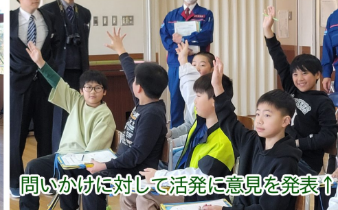
問いかけに対して活発に意見を発表↑

本取り組みは、これまでの「説明型学習」から脱却し、子どもたちが主体的・体験的に「自ら学ぶ」ダム見学会を目的に実施しました。