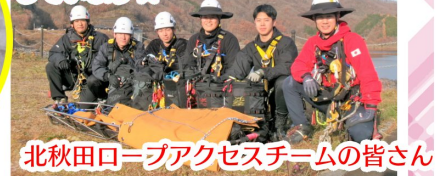
北秋田ロープアクセスチームの皆さん

11月26日、県北で消防士として活動する方々によるダム洪水吐を利用したロープレスキュー訓練が行われました。高所から落下した要救助者を担架に収容し、引き上げる想定で実施されました。メンバーの方は、「普段は訓練に適した場所が少ないため体育館や公園を利用して行っている。森吉山ダムでは大会の会場や実際の救助現場と近いロケーションで訓練でき、とてもためになりました！」と訓練の疲れを感じさせない笑顔でお話ししてくださいました(^^)