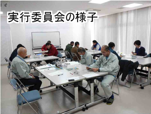
実行委員会の様子

12月12日（月）今年度の森吉山ダム水源地域ビジョン活動の総括を行うため「第5回森吉山ダム水源地域ビジョン実行委員会」がダム管理支所にて開催されました。委員会には13名が参加し、今年度の活動の反省や、来年度の活動に向けた様々な意見が出されました。