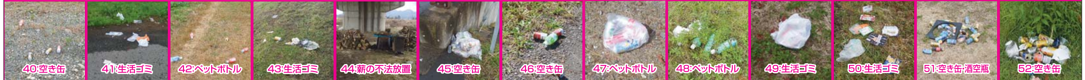
40:空き缶 41:生活ゴミ 42:ペットボトル 43:生活ゴミ 44:薪の不法放置 45:空き缶 46:空き缶 47:ペットボトル 48:ペットボトル 49:生活ゴミ 50:生活ゴミ 51:空き缶;酒空瓶 52:空き缶