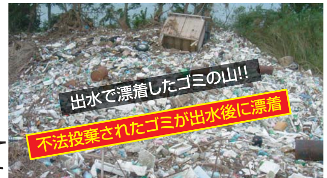
出水で漂着したゴミの山!!