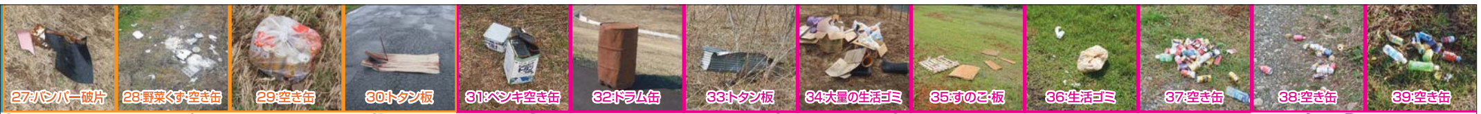
27:ハンバー破片 28:野菜くず空き缶 29:空き缶 30:タン板 31:ペンキ空き缶 32:ドラム缶 33:タン板 34:大量の生活ゴミ 35:すのこ板 36:生活ゴミ 37:空き缶 38:空き缶 39:空き缶