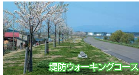
堤防ウォーキングコース