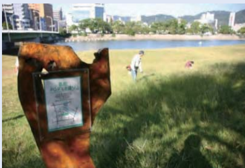
市民団体による看板設置事例 (太田川)

これらの河川法上の許可等について、河川管理者との協議の成立をもって足りることとなります。