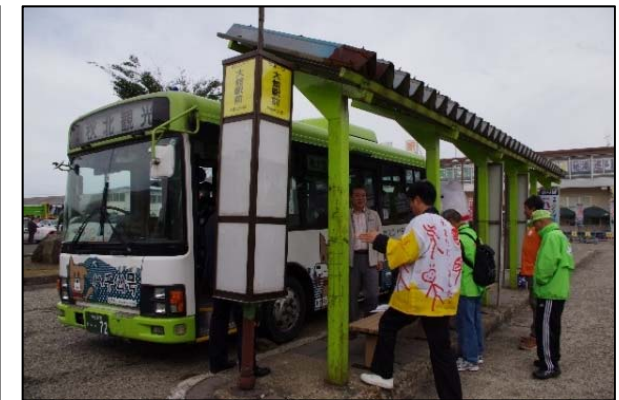
▲大館周遊バス (イメージ)