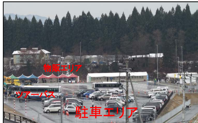
▲PAにて乗換 (社会実験イメージ)