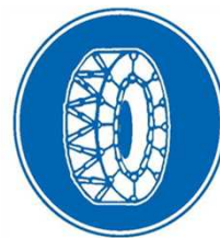
チェーン規制標識 「タイヤチェーンを取り付けていない 車両通行止め」

※ 異例の降雪が予想される2～3日前から、交通障害が発生するおそれがあることについて、事前広報を行い、不要不急の外出を控えることや広域迂回などを、記者発表、ラジオやSNSなどを活用してお知らせしますので、お出かけの前の確認をお願いします。