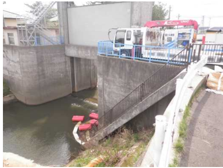
排水ポンプ車設置状況