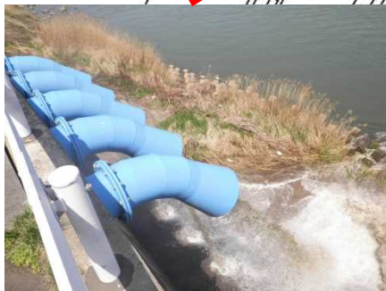
排水機場排水状況(吐水側)

③吸水槽に規定水位(H=1.75m)まで貯留完了後、排水機場を稼働。吸水槽から米代川へポンプアップ開始。