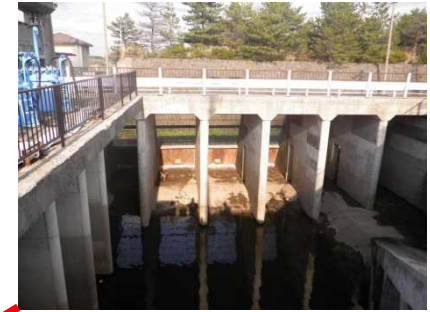
吸水槽スクリーンへの型枠合板貼付状況