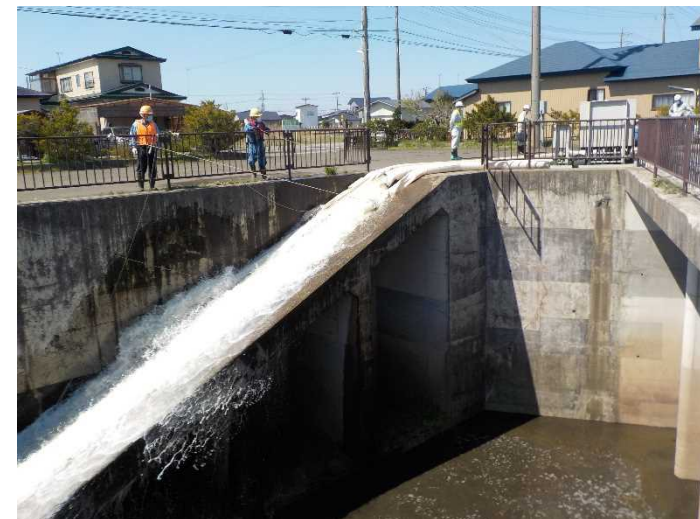
過年度実施状況写真