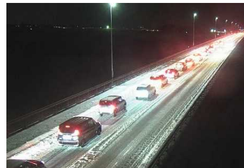
【写③】R4.1.4 国道7号の交通混雑状況