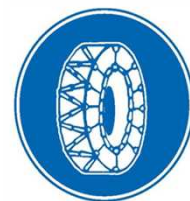
チェーン規制標識 「タイヤチェーンを取り付けていない 車両通行止め」

「チェーン規制」を実施する際は、規制実施区間の手前に上記の標識が掲示されますので、規制区間を走行される方は「チェーン」の装着をお願いします。