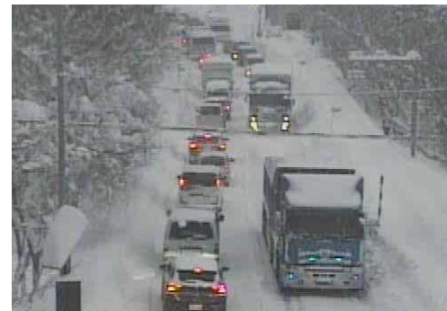
【写①】R3.12.27 国道4号の交通混雑状況