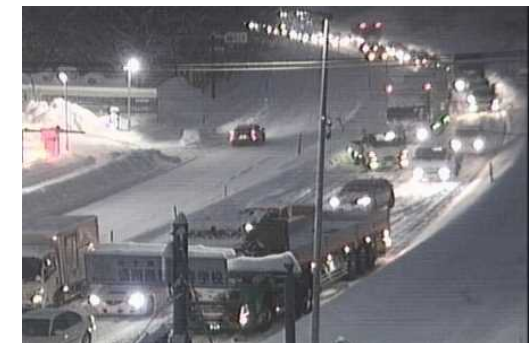
【写④】R5.2.1 国道4号の交通混雑状況