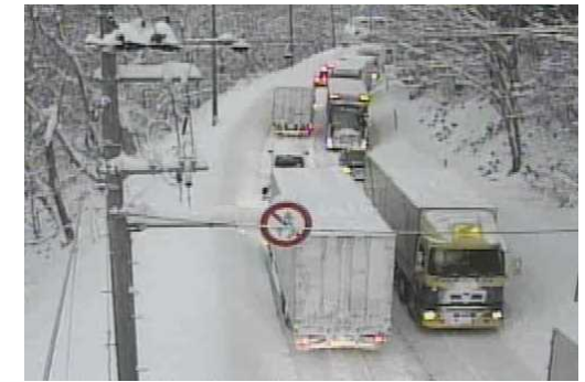
【写②】R3.12.28 国道7号の交通混雑状況