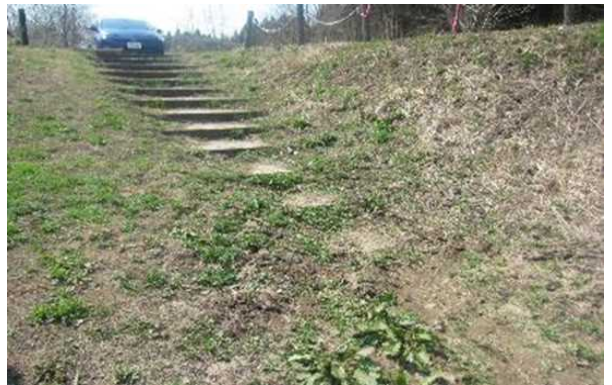
●遊歩道階段に土砂堆積