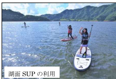
湖面 SUP の利用