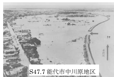
S47.7 能代市中川原地区