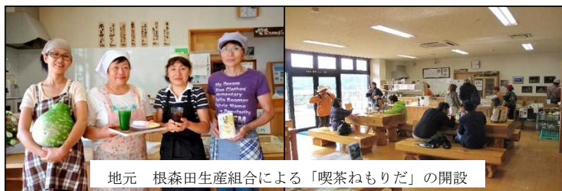
地元 根森田生産組合による「喫茶ねもりだ」の開設