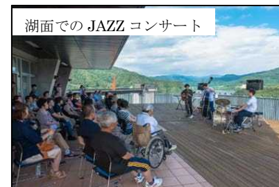
湖面でのJAZZコンサート