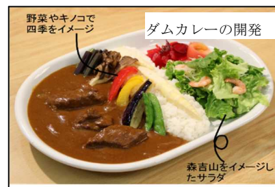
野菜やキノコで四季をイメージ