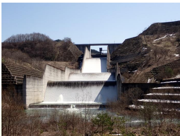
「ダム下流側から（令和8年4月6日撮影）」

森吉山ダムでは、融雪と降雨による出水により、4月4日からダム放流（洪水吐からの越流）中です。