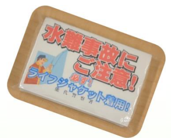
能代警察署で ティッシュを配布