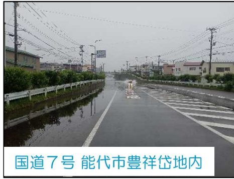
国道7号 能代市豊祥岱地内