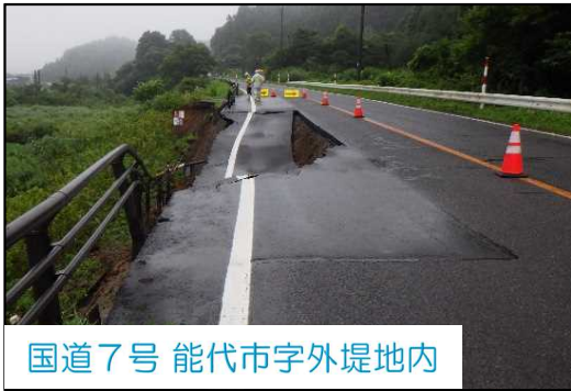
国道7号 能代市字外堤地内