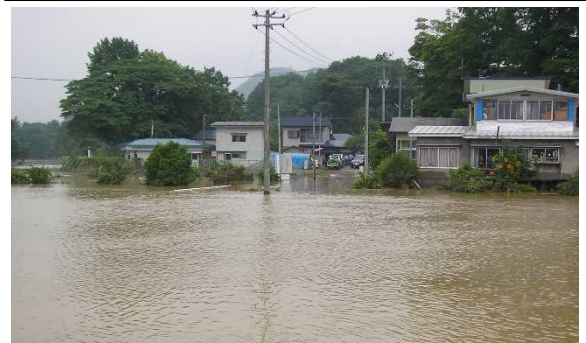
平成25年8月洪水 浸水状況

平成25年8月洪水と同等の洪水が発生した場合でも早口地区の家屋浸水被害を解消します。