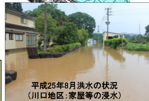
平成25年8月洪水の状況 (川口地区:家屋等の浸水)

河道掘削及び築堤を実施することで、平成25年8月と同規模の洪水が発生した場合でも家屋17戸の浸水被害が解消されます。