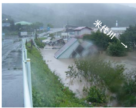
▲河川防災ステーション整備イメージ(災害時)