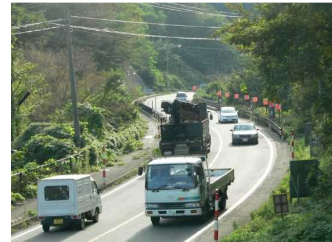
▲国道7号の線形不良箇所

ニツ井今泉道路の整備により、災害時のリダンダンシー確保や速達性向上等が図られます。