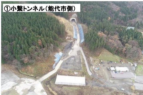
①小繋トンネル(能代市側)