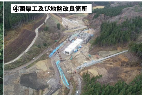
④函渠工及び地盤改良箇所