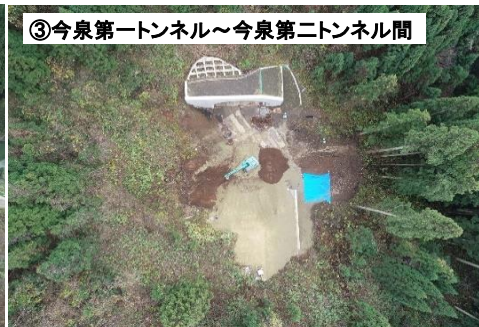
③今泉第一トンネル～今泉第二トンネル間