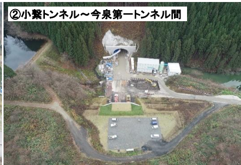
②小繋トンネル～今泉第一トンネル間