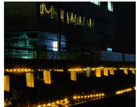
能代河川国道事務所の灯り展示。函館のシーニックバイウェイの皆さん伝授によるワックスキャンドルの温かみがLEDライトに映えます。