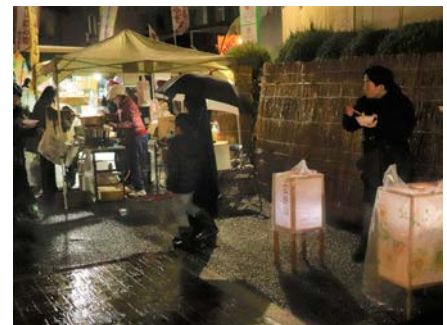
「広瀬川せせらぎ緑道」の行燈展示