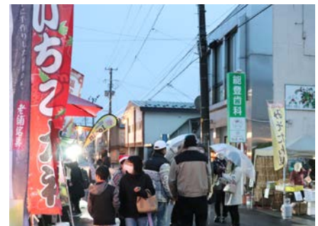
あいにくのお天気にも関わらず、上町通りは多くの来場者で賑わいました。