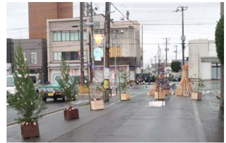
上町通り入り口にセッティングした「ティピー灯り」「杉ツリー灯り」「ミルクキーキャンドル」