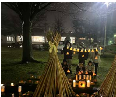
能代中央公民館敷地内には、スギ灯りをはじめの色々な灯りが展示されました。