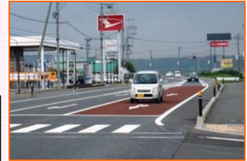
【カラー舗装施工後】 舗装面の滑り抵抗の向上による スリップ防止の効果も!

国土交通省では、限られた予算の中で交通事故対策への投資効率を最大限高めるため、交通事故対策を優先的に進める事故危険区間を選定し、事故原因に即した効果の高い対策を実施していくものです。