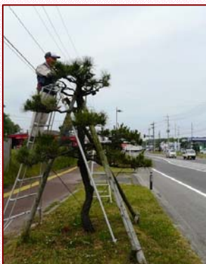
～会員の皆さんが腕をふるい 152本の松の剪定が終了～

国道7号(能代港入口交差点～豊祥岱交差点)の黒松の剪定は、松葉の回収などの支援のもとボランティア団体「能代バイパス黒松友の会」が行っています。今年も6/18～19(土・日)で春の剪定作業が終了し、黒松街道がスッキリと生まれ変わりました。