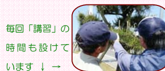
毎回「講習」の時間も設けています! →