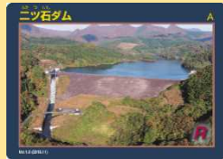
「漆沢ダム」と「ニツ石ダム」