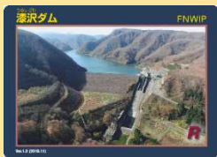
「漆沢ダム」と「ニツ石ダム」