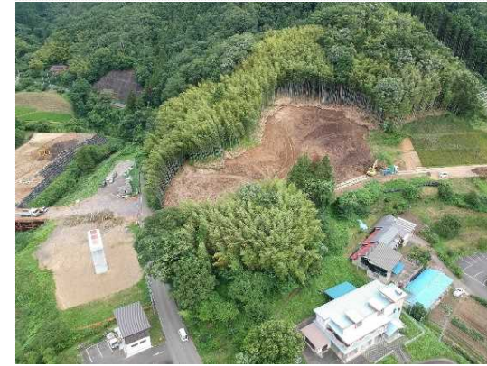
③ 道路土工(掘削)施工中