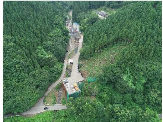
① トンネル掘削に向け仮設備設置中