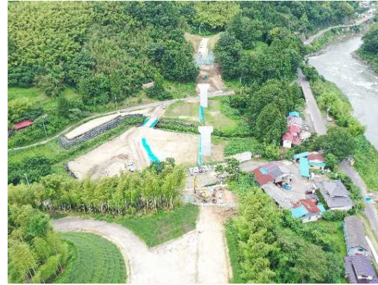
② 橋梁下部工(A1,A2)施工中