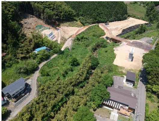
② 橋梁下部工(P1,A2)着手に向け準備中