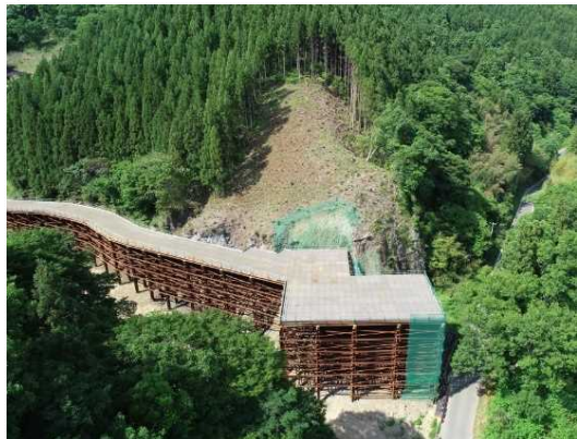
① トンネル掘削に向け準備中