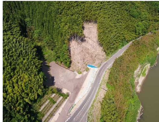
③ トンネル掘削に向け準備中