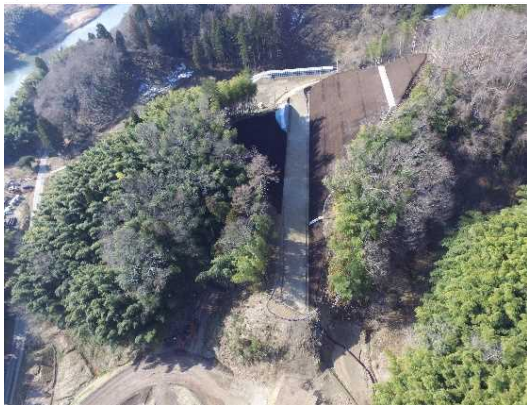
① 道路土工(盛土)、法面工完成