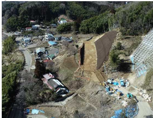
② 道路土工(切土)、法面工施工中