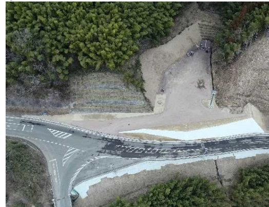
③ トンネル施工のための仮設備ヤード完成