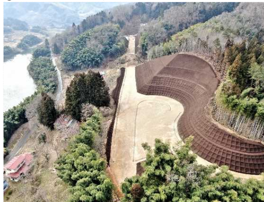
② 道路土工(切土)、法面工完成