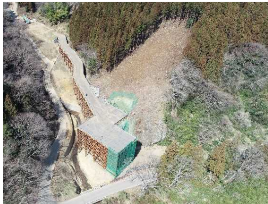
① トンネル施工のための仮橋・仮設構台工完成