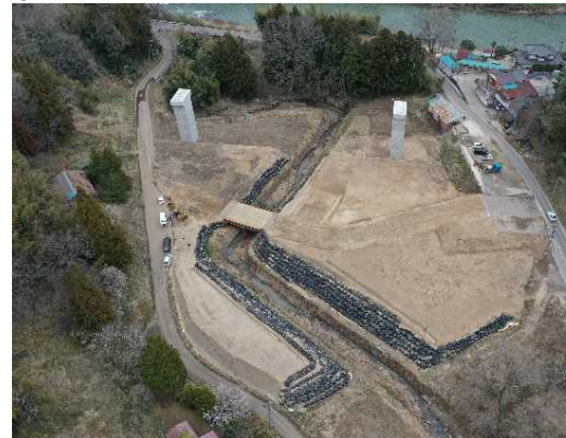
③ 橋梁下部工完成(第1号橋:P1,P2)