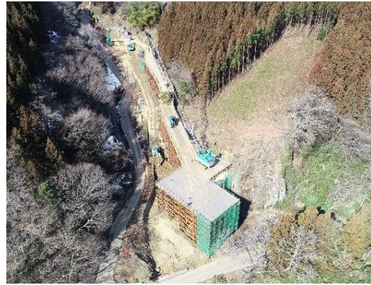
① トンネル施工のための仮橋・仮設構台工施工中