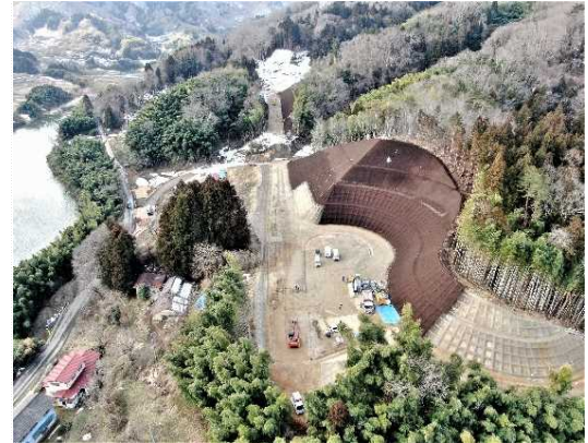
② 道路土工(切土)、法面工施工中