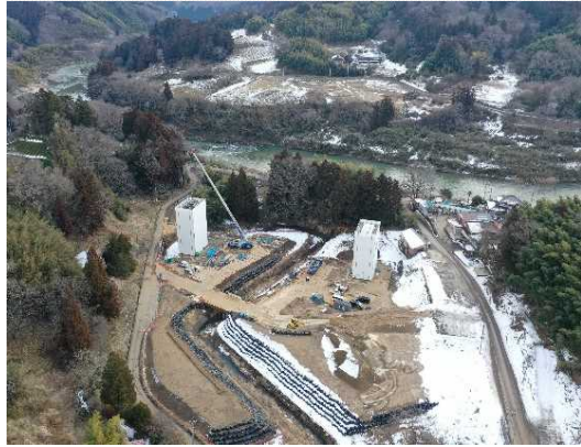
③ 橋梁下部工施工中(第1号橋)