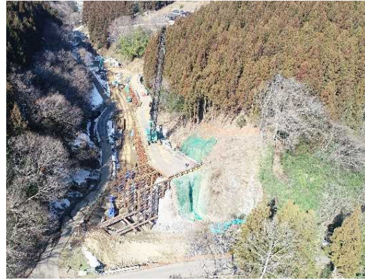
① トンネル施工のための仮橋・仮設構台工施工中