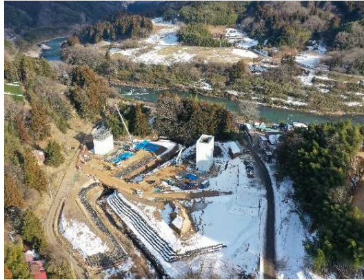
③ 橋梁下部工施工中(第1号橋)