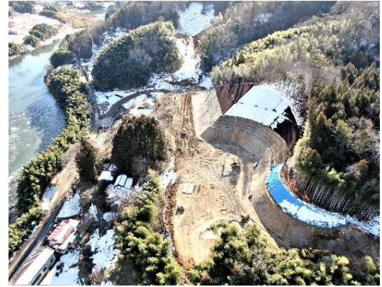
② 道路土工(切土)、法面工施工中