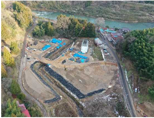
③ 橋梁下部工施工中(第1号橋)