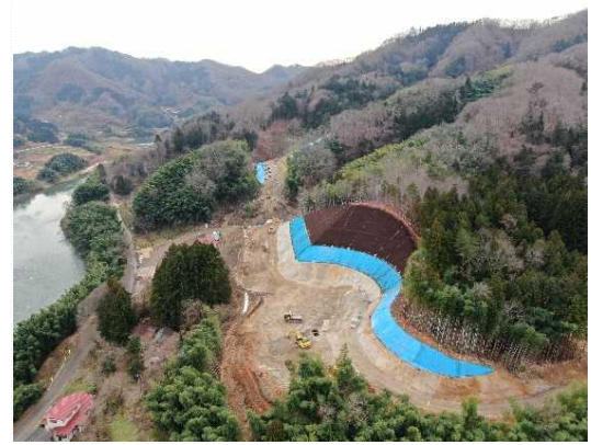
② 道路土工(切土)、法面工施工中