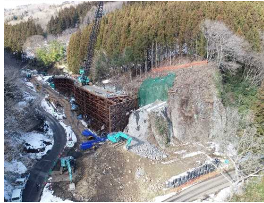
① トンネル施工のための仮橋・仮設構台工施工中