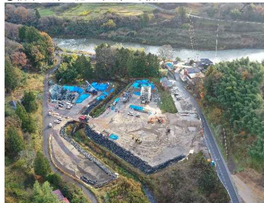
③ 橋梁下部工施工中(第1号橋)