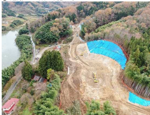
② 道路土工(切土)施工中