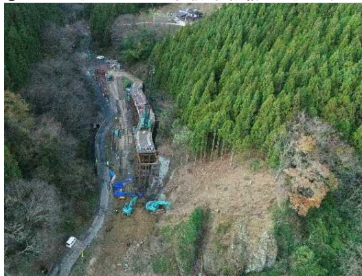
① トンネル施工のための仮橋・仮設構台工施工中