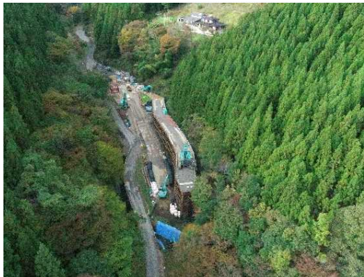
① トンネル施工のための仮橋・仮設構台工施工中