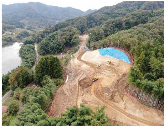
② 道路土工(切土)施工中