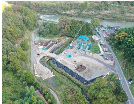
③ 橋梁下部工施工中(第1号橋)