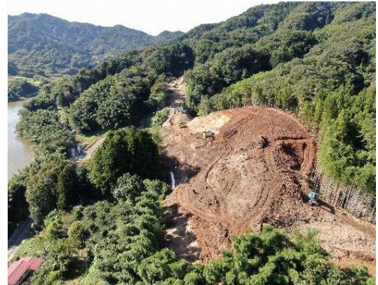
② 道路土工(切土)施工中