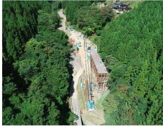
① トンネル施工のための仮橋・仮設構台工施工中