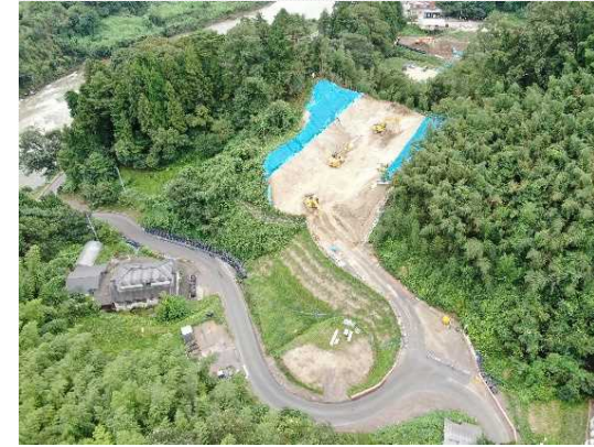
③ 道路土工(切土)施工中