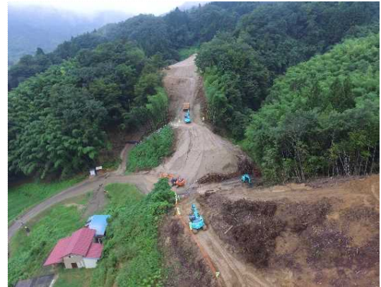
② 道路土工(切土)施工中