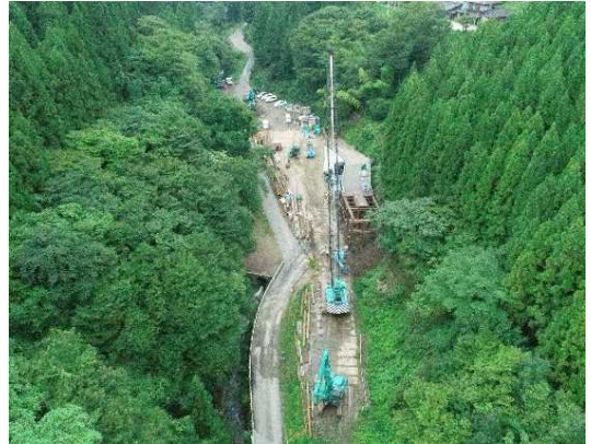
① トンネル施工のための仮橋・仮設構台工施工中