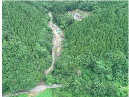
① トンネル施工のための仮橋・仮設構台工施工中