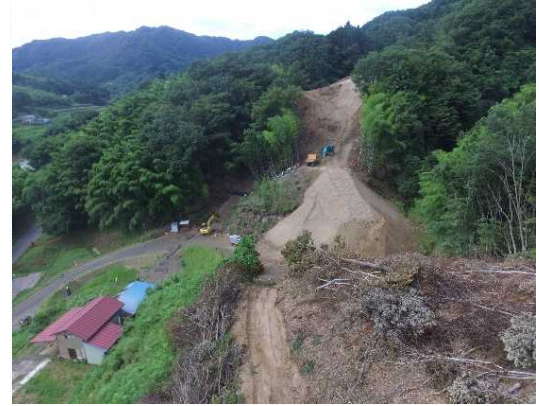
② 道路土工(切土)施工中