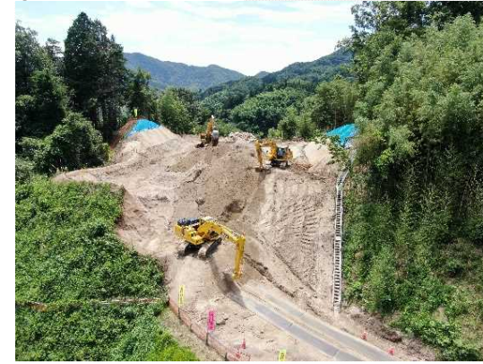
③ 道路土工(切土)施工中