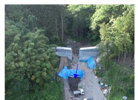
大畑沢砂防堰堤（新設）