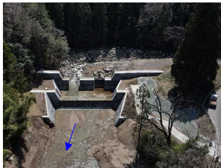
土ヶ森砂防堰堤（改築）