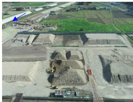
築堤盛土材 改良ヤード