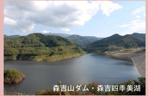
森吉山ダム・森吉四季美湖