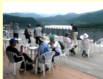
湖を眺めながら食事ができます。