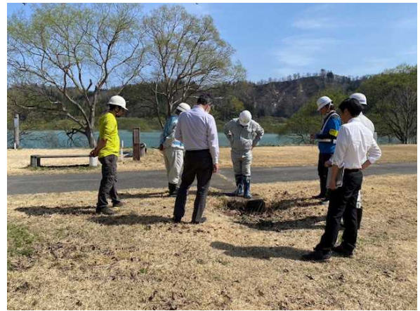
白川ダムの点検実施状況 (湖岸公園)