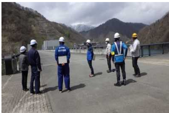
長井ダムの点検実施状況 (ダム天端)