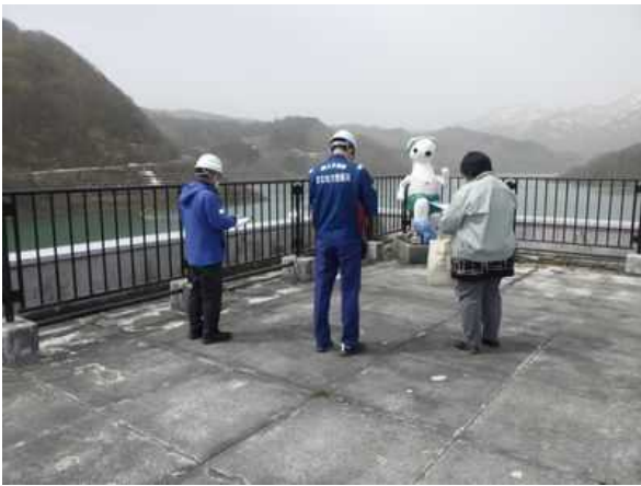
寒河江ダムの点検実施状況 (ダム周辺)