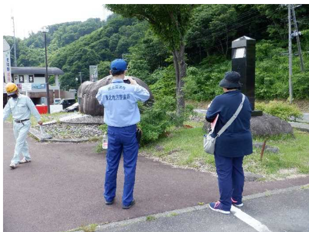
寒河江ダムの点検実施状況(砂子閣展望広場)