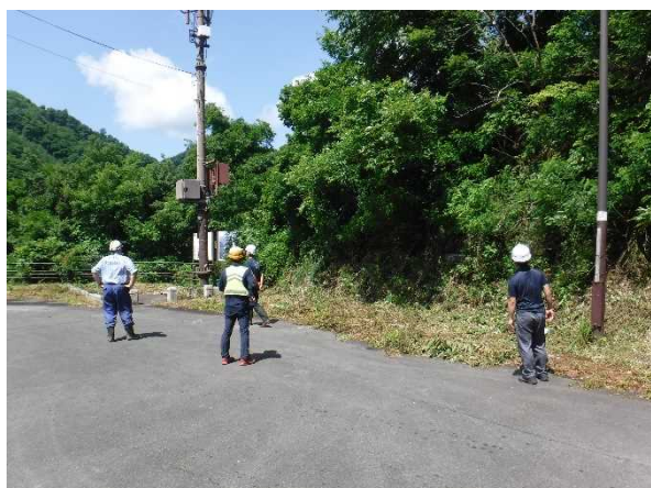
長井ダムの点検実施状況(竜神大橋広場)