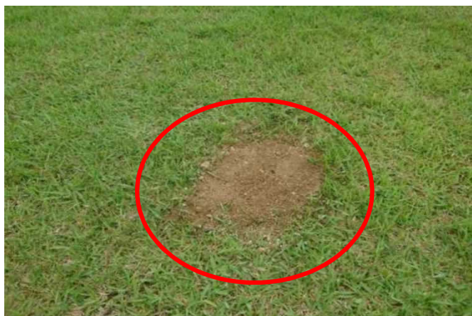
白川ダムの応急対策状況(湖岸公園)