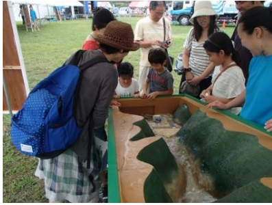
土石流について学べる 土石流模型実験