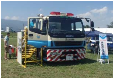
排水ポンプ車試乗