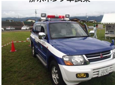
河川パトロールカー試乗