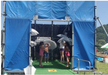
最大200mm/hの雨量が 体験できる降雨体験館