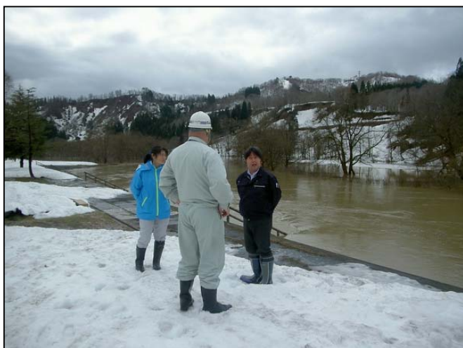
白川ダム [湖岸公園]