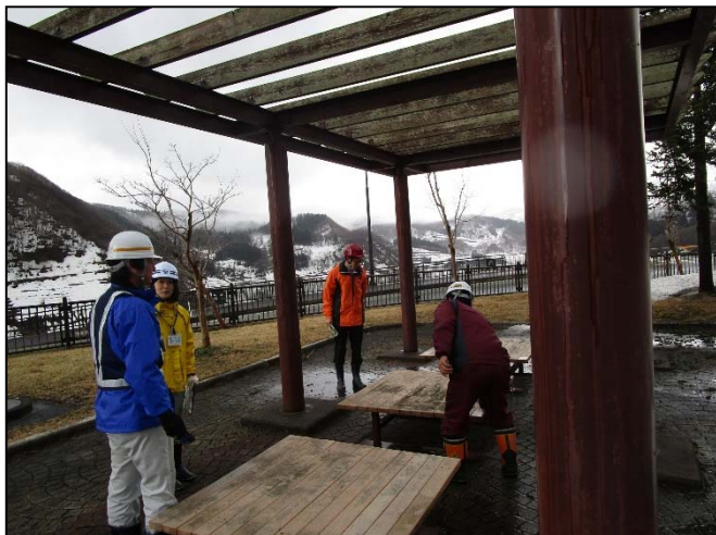
寒河江ダム [管理庁舎周辺]