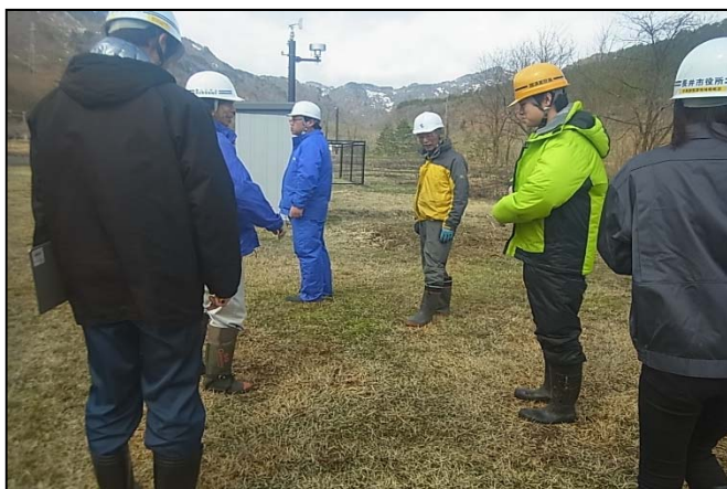
長井ダム [野川防災センター (まなび館)]