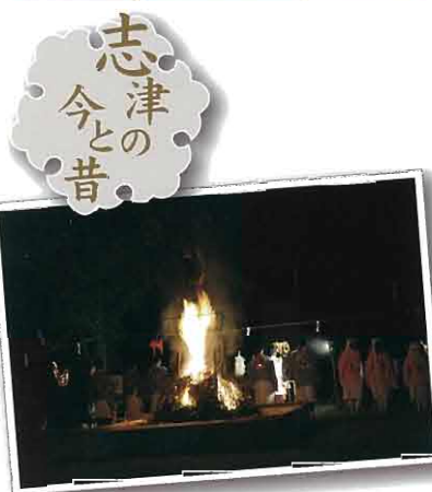
▲火合わせ神事 かがり火祭 春の六十里越街道