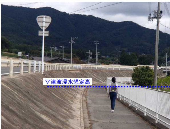
▲現在の歩道整備状況