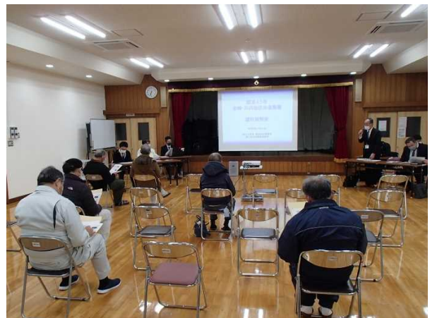
▲説明会の開催状況