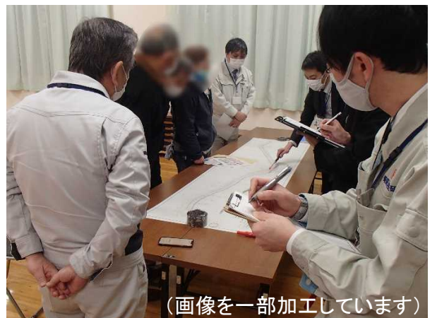
▲地域住民との質疑応答