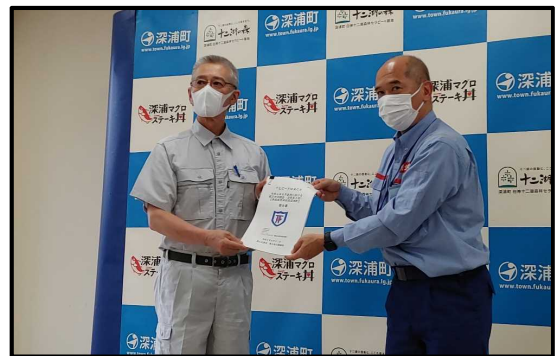
▲深浦町長へ報告書手交