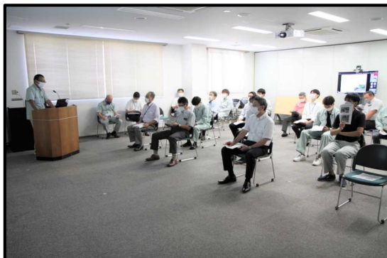
▲事務所職員への報告