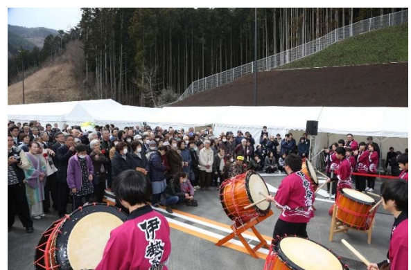
▲大沢打ちばやしの実演