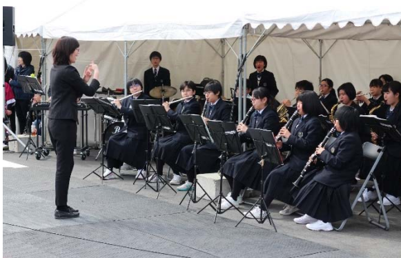
▲高田第一中学校吹奏楽部の演奏