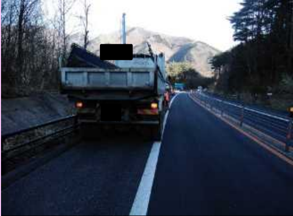
釜石市甲子町付近

E46釜石道では今年度、エンジントラブルや、タイヤのバーストなどが原因で、路肩に停車する事象が数多く発生しています。路肩に停車することは、後続車両追突の危険だけでなく、大型車などの場合、後続車両が通れずに車両滞留が発生し、大規模な交通障害に発展してしまいます。 運行前の始業前点検を行うようにしましょう。