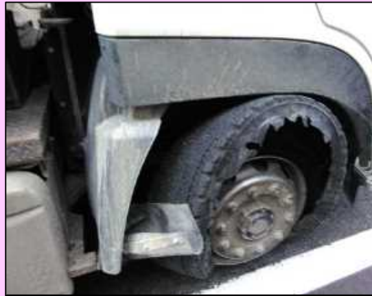
右前輪のタイヤがバースト