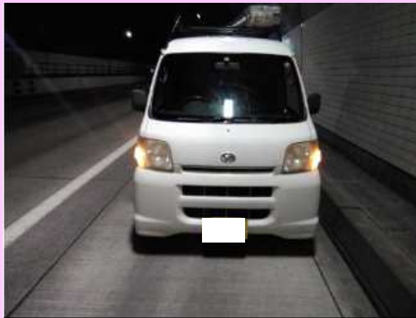
新仙人トンネル内でエンジントラブル