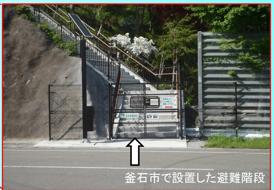
釜石市で設置した避難階段