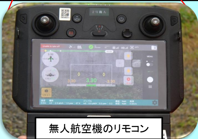
無人航空機のリモコン