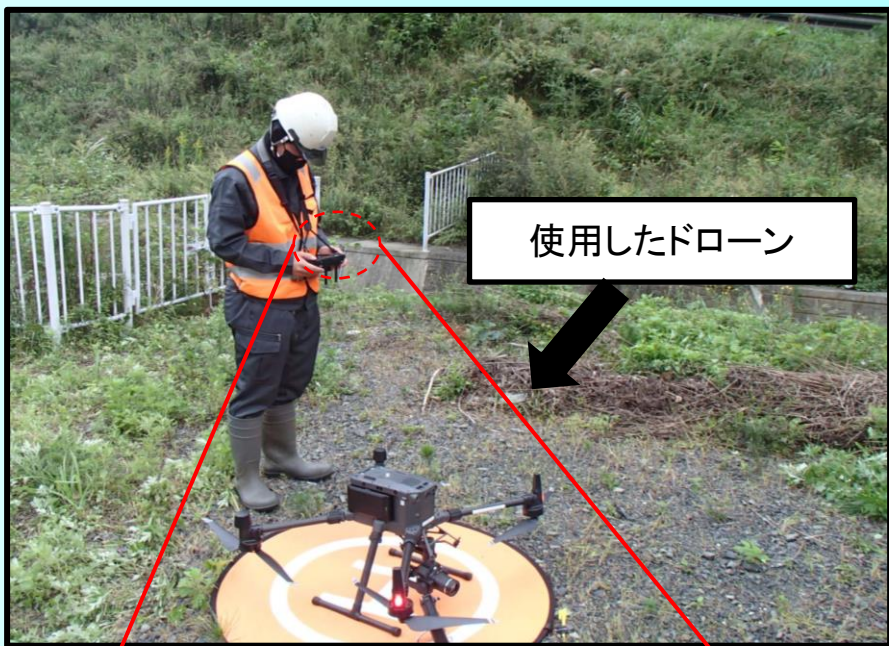
使用したドローン